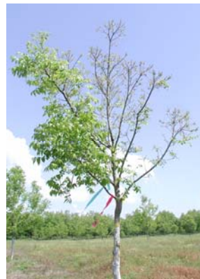
Izq.: Tratamiento con Ni en octubre Derecha: sin tratar