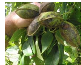
Fungicidas sin Ni