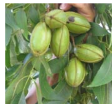
Fungicidas + NiPlus