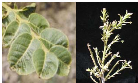
Síntomas típicos de “oreja de ratón”

la concentración foliar de níquel es menor que 5 ppm de Ni, los árboles realizan menos eficientemente la movilización del nitrógeno almacenado al llegar la primavera.